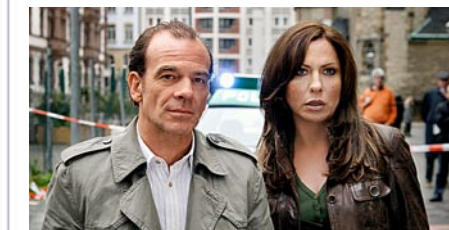
Das Tatort-Kommissarenpaar ermittelt in Leipzig