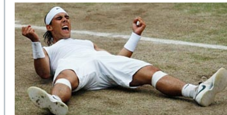
Rekordfinal mit Traumquote – trotz Nadals Sieg